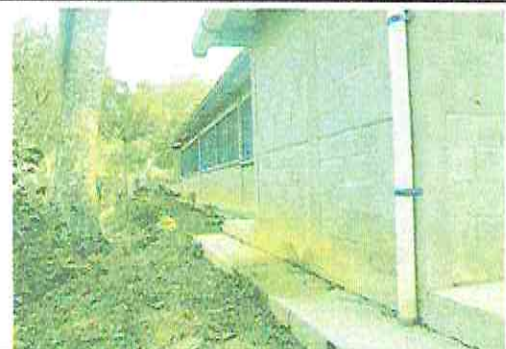
Foto 2: pintar partes externas del establecimiento INEBTS La Laguna La Unión Zacapa.