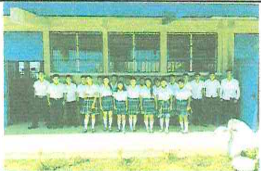
Foto 1: Pintar partes internas del establecimiento INEBTS Aldea La Laguna, La Unión zacapa.