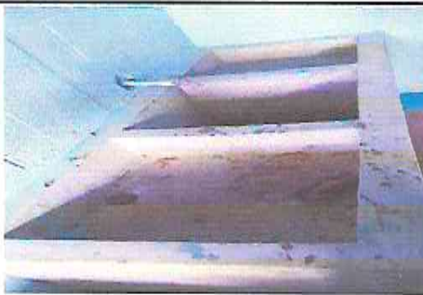
Foto 5: Instalación de agua potable piletta, chorro, valvula, tubería.