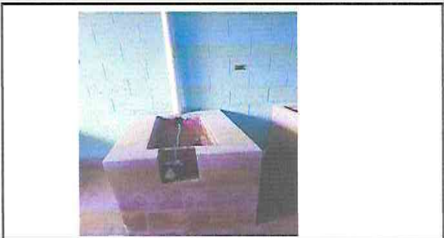
Foto 8: Mantenimiento de estufa rural (plancha, chimenea, ladrillo tayuyo).