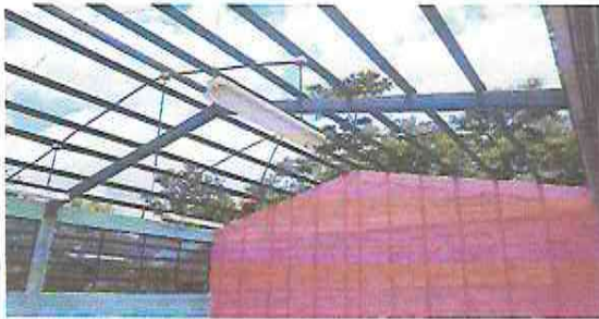
Foto1: Sustitución de lámina, por lámina troquelada calibre 26.