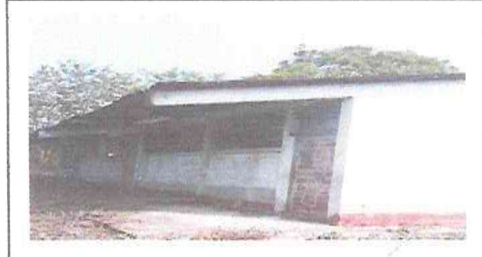
Mantenimiento de puertas (lijado y pintado)