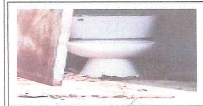
Foto: 11 Sustitucion de inodoros.