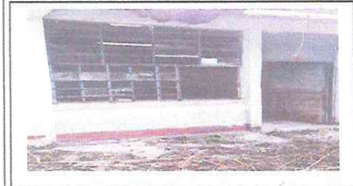
Foto 7 Sustitución de balcones de la cocina.