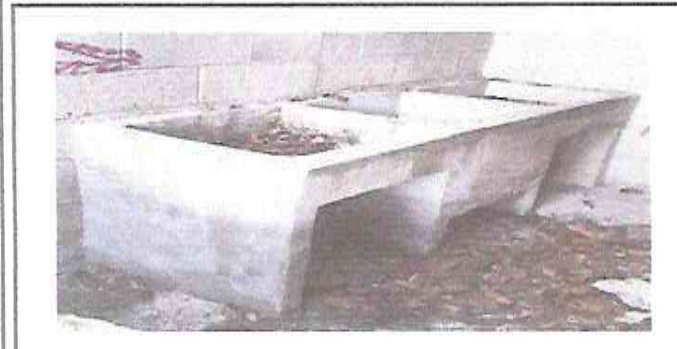
Foto 5: Intalacion de agua potable pileta, chorro, valvula tuberia.