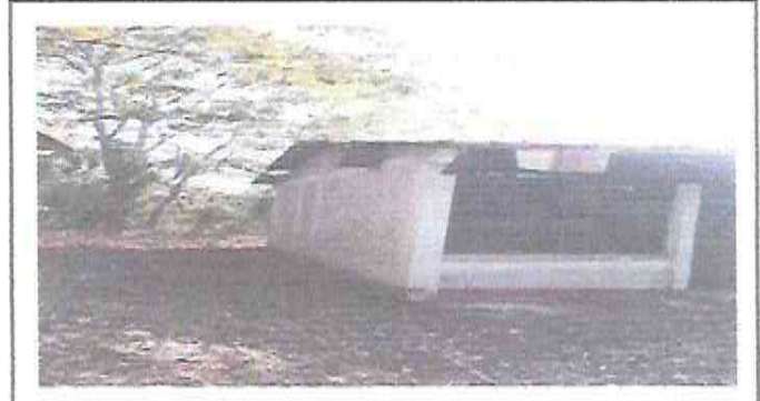
Foto 10: Sustitucion de capote de lamina, para lamina troquelada.