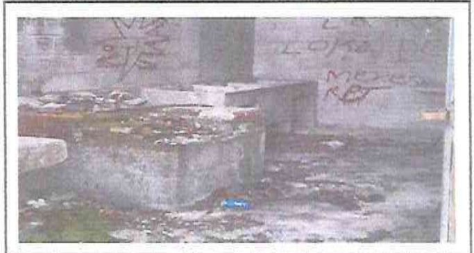
Foto 8 Mantenimiento de estufa rural (planca, chimenea, ladrillo tayuyo).