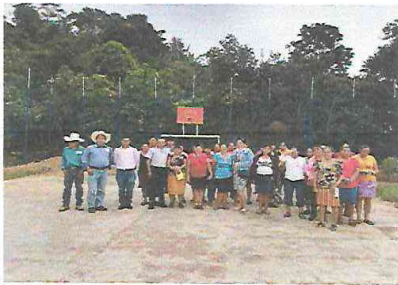
Foto 1.1 Sustitución de maya por electromalla, debido a que se vio la posibilidad de mejorar el renglon