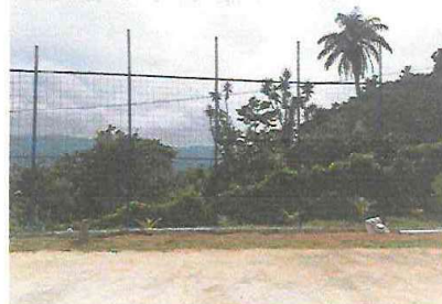
Foto 1.1 Sustitución de maya por electromalla, debido a que se vio la posibilidad de mejorar el renglon