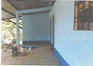
Foto 2.1 Pintura General