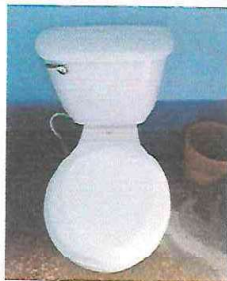
Foto 4.1 Instalación de inodoros