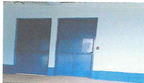
Foto 4.2 Mantenimiento con pintura para puertas

Observación: Si es necesario se pueden agregar hojas adicionales y actualizar el número de hojas.