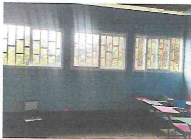
Foto 3.1 Instalación de ventanas PVC de 1 x 1.40