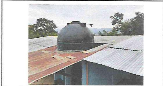
Foto 4.3 Instalacion de Tinaco existente con accesorios