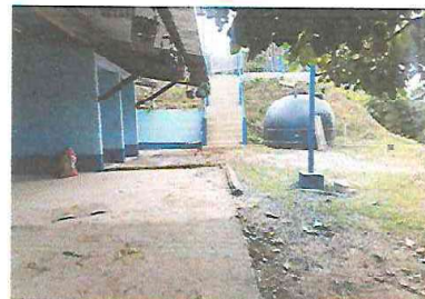
Foto 2.1 Pintura General