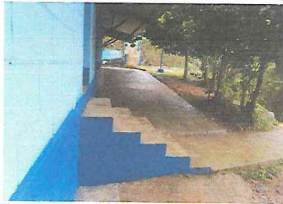
Foto 3.2 Mejoramiento de patio con pavimento