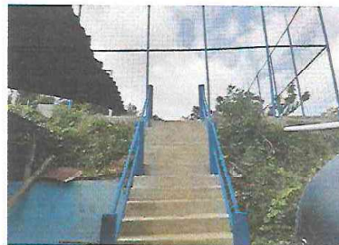
Foto 1.3 Barandal con tubo redondo galvanizado