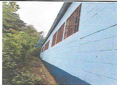
Foto 2.1 Pintura General