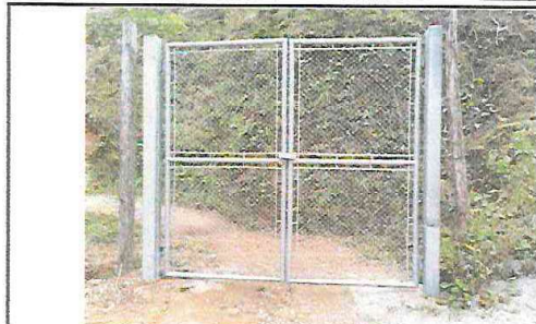
Foto 5.1 Instalar puerta con malla metalica de 2x1

Observación: Si es necesario se pueden agregar hojas adicionales y actualizar el número de hojas.