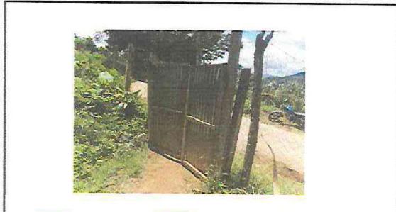
Foto 5.1 Instalar puerta con malla metalica de 2x1

Observación: Si es necesario se pueden agregar hojas adicionales y actualizar el número de hojas.