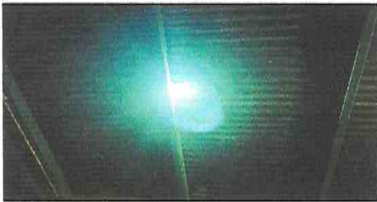
FOTO 3: Sustitución de lámina, por lámina troquelada aluzinc calibre 26