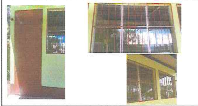
Foto 1: mantenimiento. (lijado, cambio de tubo, cepillado, sujeción, aplicación de pintura) en puertas, Sustitución de vidrios (percianas).