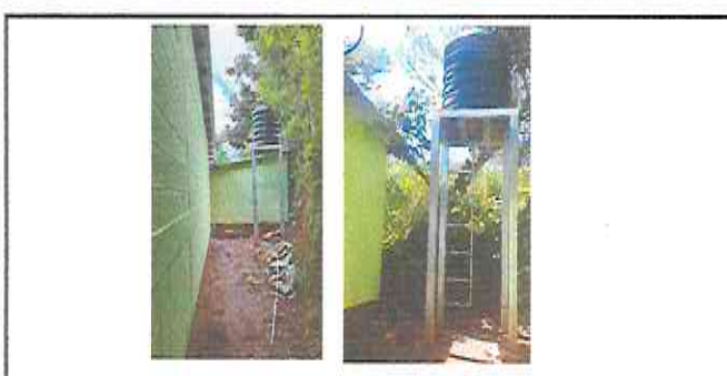
Foto 5: suministro de estructura metalica para deposito de agua 3 metros de alto, suministro de instalación de tanque de agua para almacenamiento de agua de 750lt.