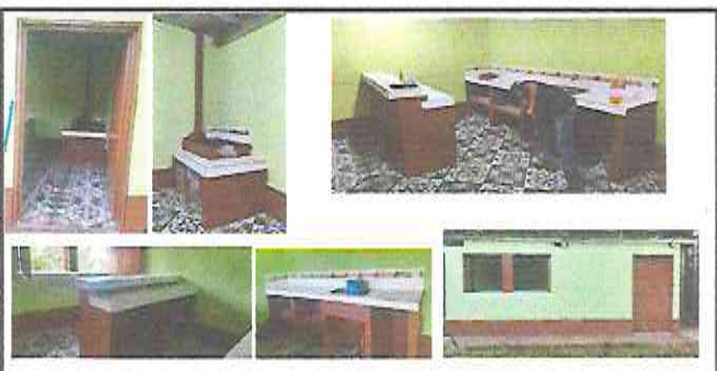
Foto 4: Instalación de azulejo en estufa, muebles de cocina, sustitución de piso ceramico, sustitución de lamparas tipo led, sustitución de plafoneras, sustitución de interruptores simples. sustitución de tomacorrientes.