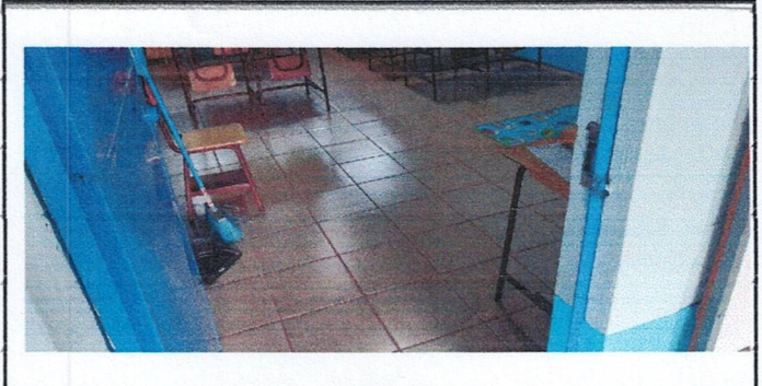
Foto 2: Reparación de 2 Aulas, Cocina y Corredor con Piso Ceramico. (AULA)