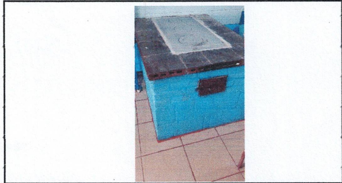
Foto 3: Reparación de 2 Aulas, Cocina y Corredor con Piso Ceramico. (COCINA). Y sustitución de Plancha de 3 Hornillas y Ductos de Chimenea de lamina de zinc.