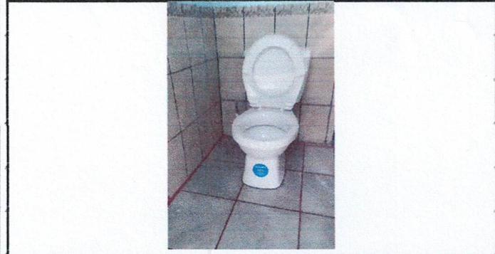
Foto 5: Reparación de Sistema de tratamiento septico existente en mal estado.