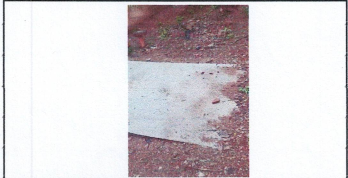
Foto 6: Reparación de Sistema de tratamiento septico existente en mal estado. Descarga hacia el pozo de absorción reparado.

Observación: Si es necesario se pueden agregar hojas adicionales y actualizar el número de hojas.