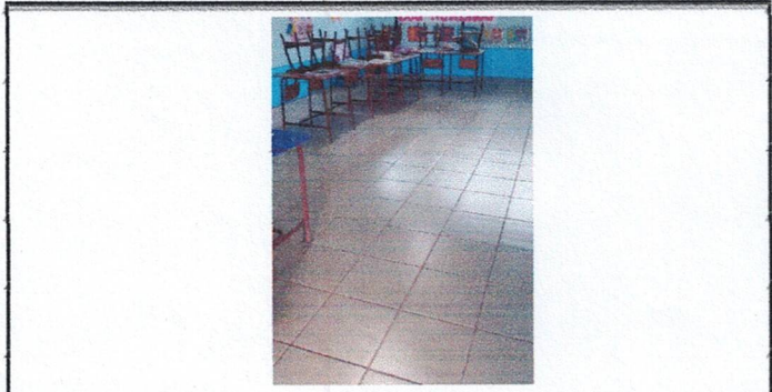
Foto1: Reparación de 2 Aulas, Cocina y Corredor con Piso Ceramico. (AULA)