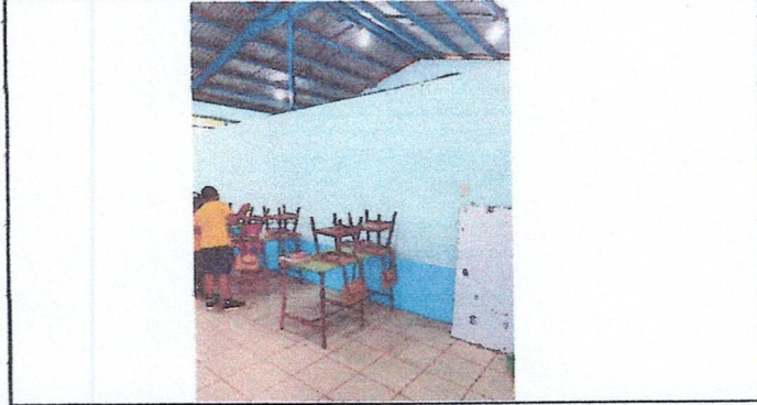
Foto 4: Reparacion Aulas, cocina, corredor y Bodega. (División de 2 Aulas, para 4 aulas con Tabique de tablayeso ambas caras).