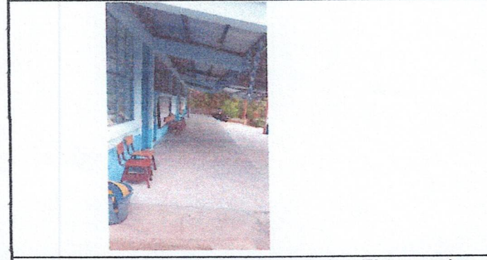
Foto 6: Reparacion Aulas, cocina, corredor y Bodega (Pintura paredes exteriores. (NO INCLUYE MURO PERIMETRAL).

Observación: Si es necesario se pueden agregar hojas adicionales y actualizar el número de hojas.