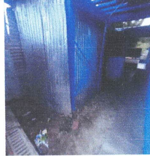
Foto 6: Reparación de Almacenamiento de Productos Alimenticios No Perecederos, Desmontaje de Torre y Deposito de Agua Potable.

Observación: Si es necesario se pueden agregar hojas adicionales y actualizar el número de hojas.