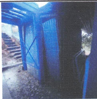
Foto 5: Reparación de Almacenamiento de Productos Alimenticios No Perecederos, Desmontaje de Torre y Deposito de Agua Potable e Iluminación.