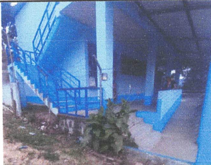
Foto 1: Reparación de Muro Perimetral en mal estado en Lado Izquierdo.