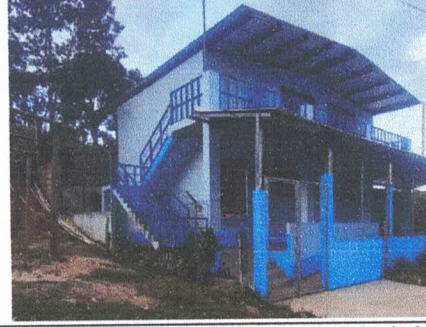
Foto 2: Reparación de Muro Perimetral en mal estado en Lado Izquierdo.