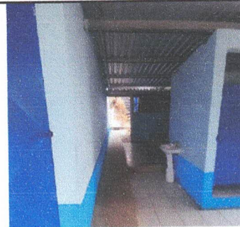
Foto 10: Reparación Techo de Cocina, Incluye Levantado de Columna Metalica, Levantado y Reinstalación de Costaneras y Lamina Troquelada calibre 26 existente en buen estado e Iluminación.