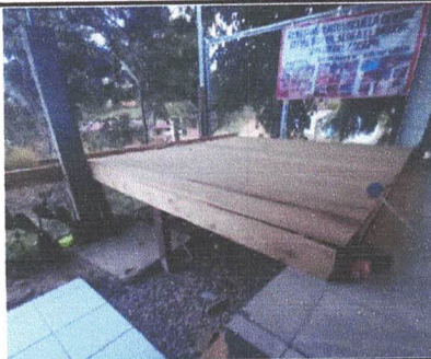
Foto 3: Reparación de Muro Perimetral en mal estado en Lado Derecho.