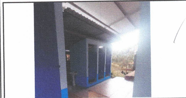
Foto 9: Reparación Techo de Cocina, Incluye Levantado de Columna Metalica, Levantado y Reinstalación de Costaneras y Lamina Troquelada calibre 26 existente en buen estado e Iluminación.