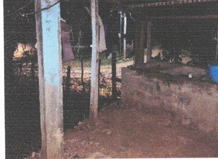
Foto 4: Reparación de Muro Perimetral en mal estado en Lado Derecho.