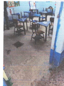
Foto 4: Reparación de Piso. Sustitución de Piso de Concreto a Piso Cerámico, Mantenimiento a Puertas metálicas.