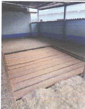
Foto 5: Reparación de agujero, Sustitución de madera por losa de patio.