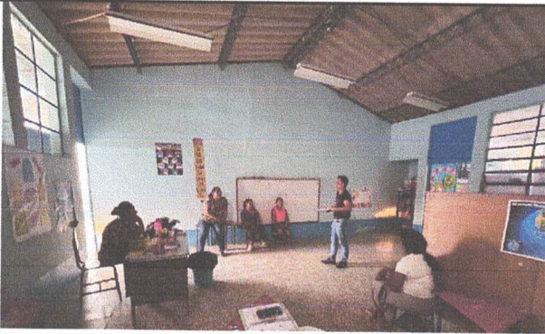
Foto 3: Reparación de Techo en Aulas, Cambio de Cubierta, Rehabilitación de Joist, cambio de Lamina Troquelada Aluzinc Calibre 26 Legítimo. (No incluye Reparación al sistema Eléctrico).