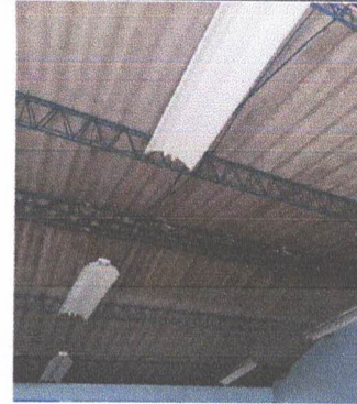
Foto 2: Reparación de Techo en Aulas, Cambio de Cubierta, Rehabilitación de Joist, cambio de Lamina Troquelada Aluzinc Calibre 26 Legítimo. (No incluye Reparación al sistema Eléctrico).