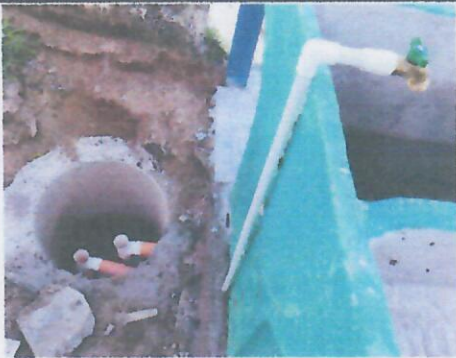
Foto 9: FABRICACION DE TRAMPA GRASA PARA DRENAJE DE PILA, INSTALACION NUEVA PARA PILA Y NUEVO GRIFO.