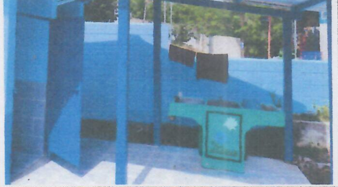
Foto 8: INTALACION DE NUEVA PILA EN EXTENCIÓN DE PISO DE CONCRETO Y RECUBIERTO POR PISO CERAMICO ANTIDESLIZANTE.