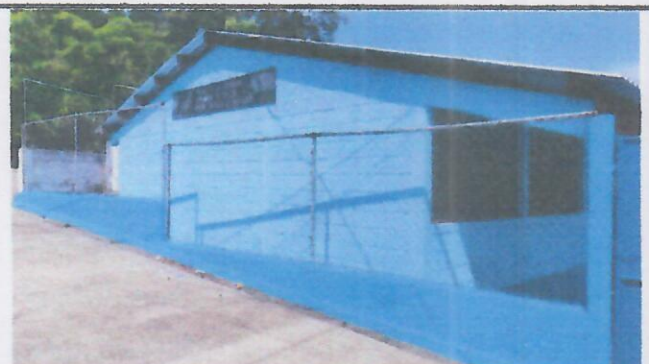
Foto 4: SUSTITUCION DE MALLA Y TUBO HG EN MURO PERIMETRAL + APLICACIÓN PINTURA EN MUROS EXTERIORES.