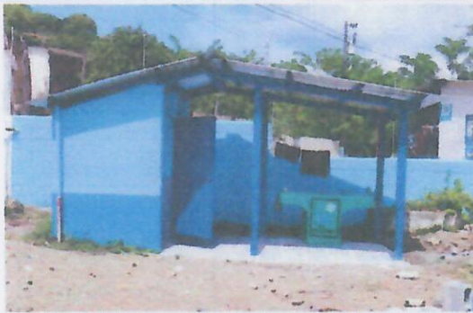
Foto 11: SUSTITUCION E INSTALACION DE ESTRUCTURA METALICA Y LAMINA TROQUELADA EN AREA DE BAÑO Y PILA + PINTURA GENERAL.