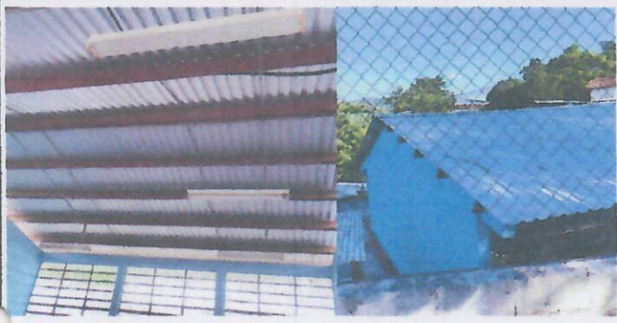
Foto 1: SUSTITUCION O INTALACION DE LAMINA TROQUELADA ALUZING CAL. 26