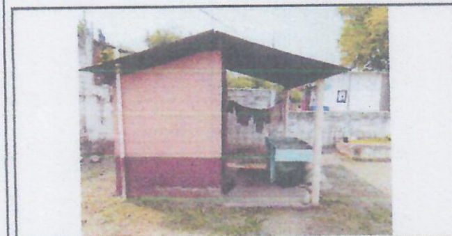
Foto 3: Pila que será reubicada, área donde se colocara torta de piso y extensión del techo de lamina.