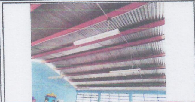
Foto 1: Lámparas dañadas que necesitan sustitución, se propone de listón tipo led.