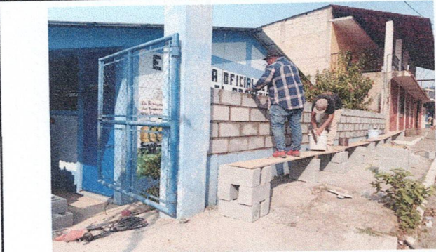
Foto1: Reparación de Muro perimetral con tabique para parte superior.