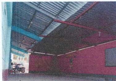
Foto2: techo de galera frente a aulas