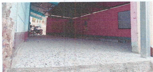
foto3: piso de Granito