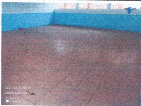
Foto 3: Sustitución de piso liquido por piso ceramico en 2 Aulas individuales.