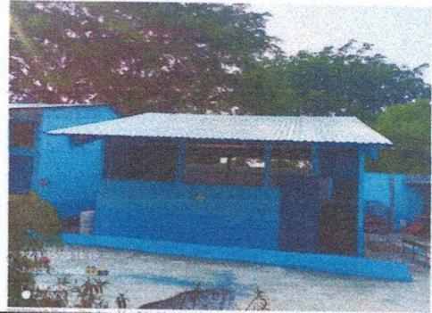
Foto 2: Lámina Acanalada sustituida por lamina troquelada aluzinc calibre 26 legitamina. Y cambio de ventanas por balcones.