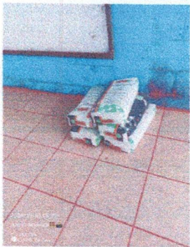
Foto 5: Sustitución de piso liquido por piso ceramico en otra Aula.