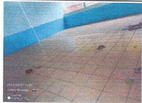
Foto 4: Sustitución de piso liquido por piso ceramico en 2 Aulas individuales.