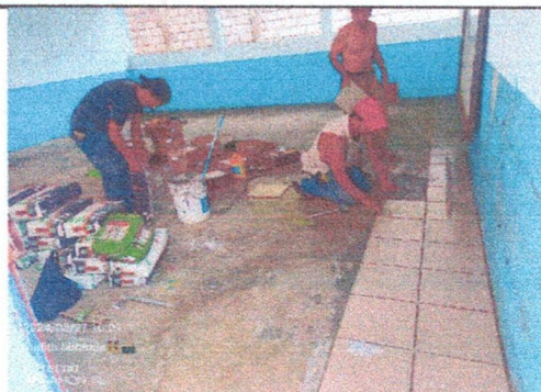
Foto 5: Sustitución de piso liquido por piso ceramico en otra Aula.