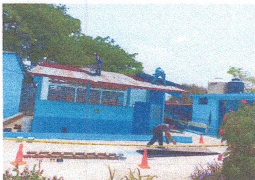
Foto1: Lámina Acanalada a sustituir por lamina troquelada aluzinc calibre 26 legitima. Y cambio de ventanas por balcones.