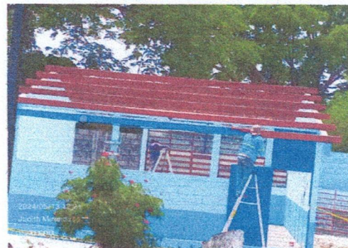
Foto 2: Lámina Acanalada a sustituir por lamina troquelada aluzinc calibre 26 legitamina. Y cambio de ventanas por balcones.