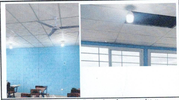
Foto 2: Instalación de sistema de iluminación y fuerza en aulas, y ventiladores.