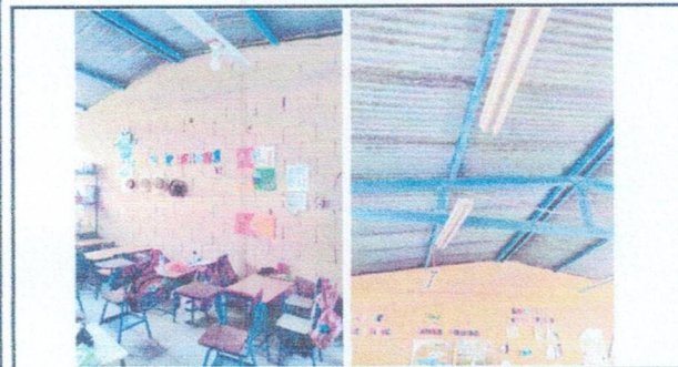
Foto 3: Sustitucion de instalacion electrica, tanto de iluminacion.