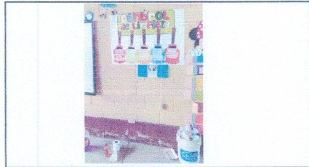
Foto 4: Sustitucion de instalacion electrica de fuerza, ya que no funciona y hay una instalacion provicional.