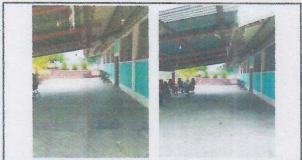
Foto 4: Techo que será sustituido en su estructura de madera por lamina y metal con costaneras.