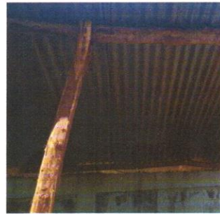
SUSTITUCIÓN O INSTALACIÓN DE ESTRUCTURA DE METAL CON COLUMNAS