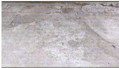
SUSTITUCIÓN DE PLANCHA DE CONCRETO EN EL PATIO POR UNA PLANCHA DE CONCRETO