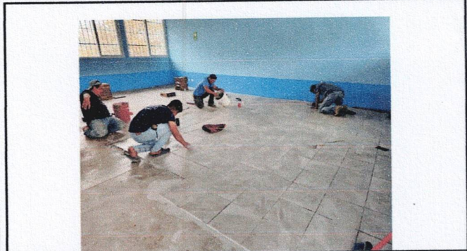
Foto1: Sustitución de Piso en Aula Pura y corredor de Párvulos