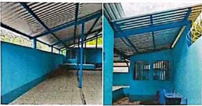
Foto 1: SUSTITUCION O INSTALACION DE TECHO, CON ESTRUCTURA BASE METALICA Y COLUMNAS DE METAL.