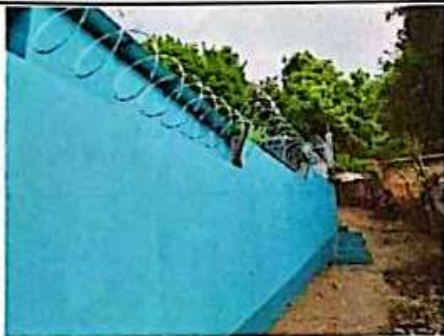
Foto 5: APLICACIÓN DE PINTURA EXTERIOR E INSTALACION DE RAZON RIBBON EN MURO PERIMETRAL.