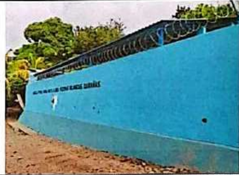
Foto 4: APLICACIÓN DE PINTURA EXTERIOR E INSTALACION DE RAZON RIBBON EN MURO PERIMETRAL.