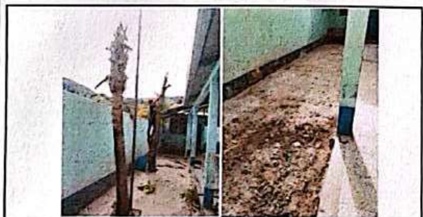
Foto 5: ELIMINACION DE ARBOLES Y NIVELACION PARA COLOCACION DE PISO DE GRANITO.