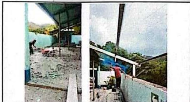
Foto 1: SUSTITUCION O INSTALACION DE TECHO, CON ESTRUCTURA BASE METALICA Y COLUMNAS DE METAL Y DEMOLICION DE COLUMNAS A REEMPLAZAR POR METAL.