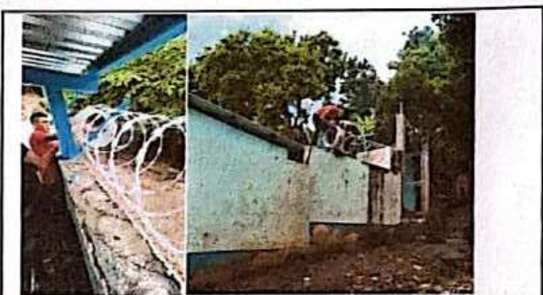
Foto 4: APLICACIÓN DE PINTURA EXTERIOR E INSTALACION DE RAZON RIBBON EN MURO PERIMETRAL.