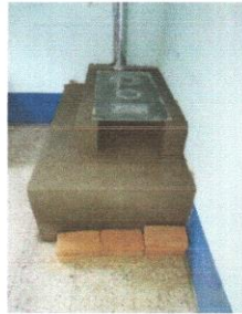
Foto 9: Sustitución de estufa rural incluye chimenea y plancha de metal