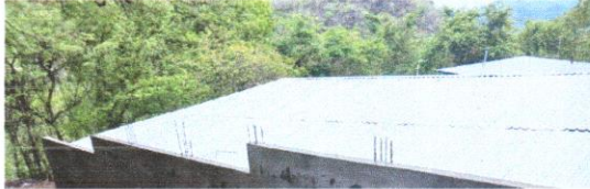
Foto 1: Sustitución de lamina por lamina troquelada aluzinc calibre 26