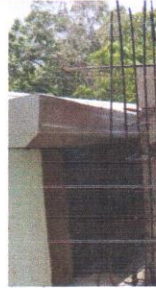
Foto 2: Sustitución de canal de metal por otro canal de metal atrás de la escuela.