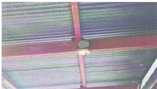
Foto1: Sustitución de iluminarias.