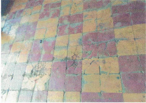
Foto1: sustitucion de piso por ceramico