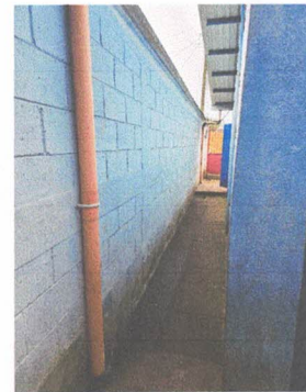
FOTO 10: INSTALACIÓN DE PUERTA DE 2 METROS DE ALTO PO 1 METRO DE ANCHO

Observación: Si es necesario se pueden agregar hojas adicionales y actualizar el número de hojas.