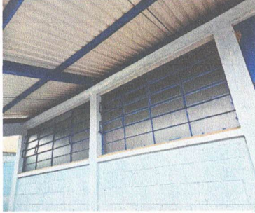
FOTO: INSTACIÓN DE LAMINA TROQUELADA Y ESTRCTURA METALICA