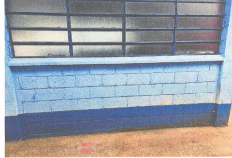
FOTO: SUSTITUCIÓN DE BALCONES