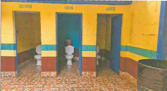
Foto 3: Instalación de piso cerámico (antideslizante) y pintura interior, exterior y puertas.