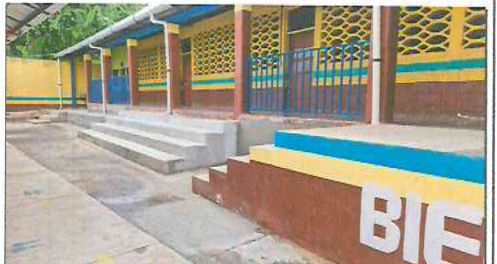
Foto 4: Construcción gradas en escenario, instalación de baranda metálica en corredor, pintura en escenario, construcción de gradas de acceso al corredor y banqueta.