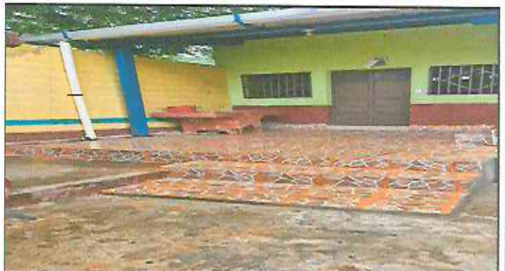
Foto 4: Reparación de torta de cemento e instalación de piso cerámico (antideslizante).