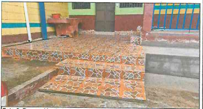
Foto 6: Reparación de torta de cemento e instalación de piso cerámico (antideslizante).

Observación: Si es necesario se pueden agregar hojas adicionales y actualizar el número de hojas.