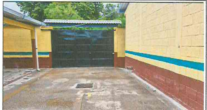
Foto 2: Sustitución de portón de ingreso de 2.5m x 4.00m y techado en área de portón con costanera + lamina troquelada aluzinc cal. 26.