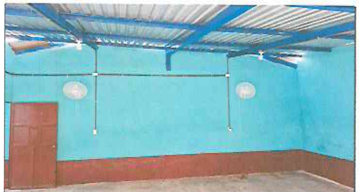
Foto 4: Retiro de lámina existente, mantenimiento de estructura existente (limpieza, lijado y pintura anticorrosiva), reforzamiento de estructura con costanera de 2x6, instalación de lámina troquelada aluzinc cal. 26.