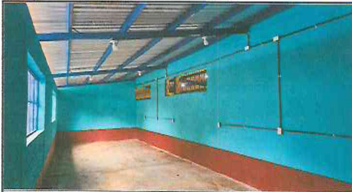
Foto 1: Retiro de lámina existente, mantenimiento de estructura existente (limpieza, lijado y pintura anticorrosiva), reforzamiento de estructura con costanera de 2x4, instalación de lámina troquelada aluzinc cal. 26, reparación eléctrica iluminación y fuerza, levantado de hiladas de block, pintura en balcones existentes y pintura de interior y exterior.