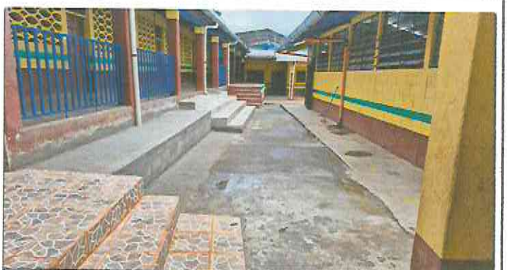
Foto 6: Construcción gradas en escenario, instalación de baranda metálica en corredor, pintura en escenario, construcción de gradas de acceso al corredor y banqueta.

Observación: Si es necesario se pueden agregar hojas adicionales y actualizar el número de hojas.