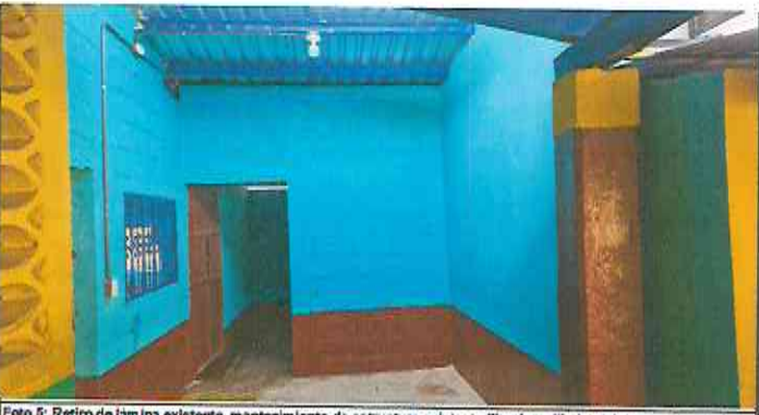
Foto 5: Retiro de lámina existente, mantenimiento de estructura existente (limpieza, lijado y pintura anticorrosiva), reforzamiento de estructura con costanera de 2x4, instalación de lámina troquelada aluzinc cal. 26, reparación eléctrica iluminación y fuerza, levantado de hiladas de block, pintura en balcones existentes y pintura de interior y exterior.