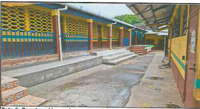
Foto 5: Construcción gradas en escenario, instalación de baranda metálica en corredor, pintura en escenario, construcción de gradas de acceso al corredor y banqueta.