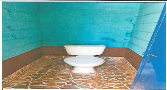
Foto 2: Instalación de piso cerámico (antideslizante) y pintura interior, exterior y puertas.