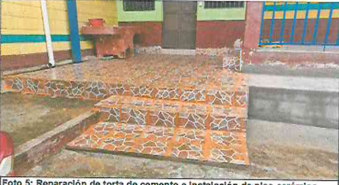
Foto 5: Reparación de torta de cemento e instalación de piso cerámico (antideslizante).