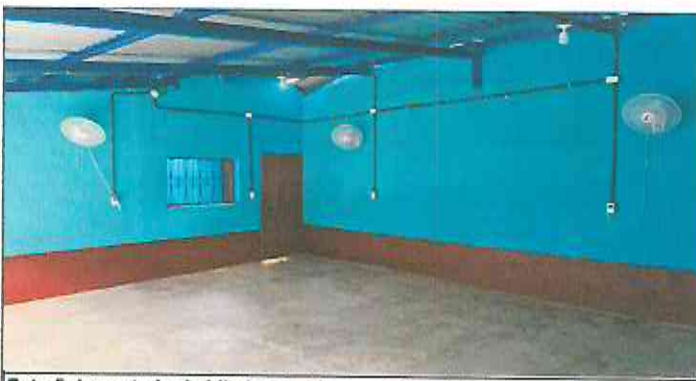
Foto 5: Levantado de hiladas de block, pintura interior y exterior.