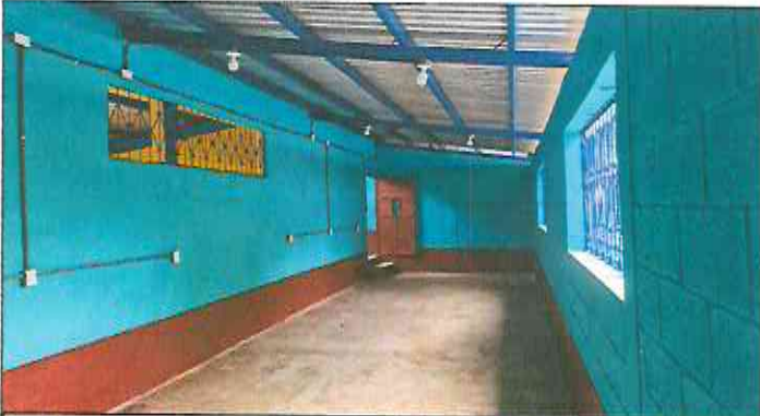
Foto 3: Retiro de lámina existente, mantenimiento de estructura existente (limpieza, lijado y pintura anticorrosiva), reforzamiento de estructura con costanera de 2x4, instalación de lámina troquelada aluzinc cal. 26, reparación eléctrica iluminación y fuerza, levantado de hiladas de block, pintura en balcones existentes y pintura de interior y exterior.