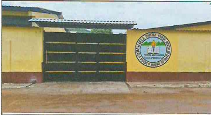
Foto 1: Sustitución de portón de ingreso de 2.5m x 4.00m y techado en área de portón con costanera + lamina troquelada aluzinc cal. 26.