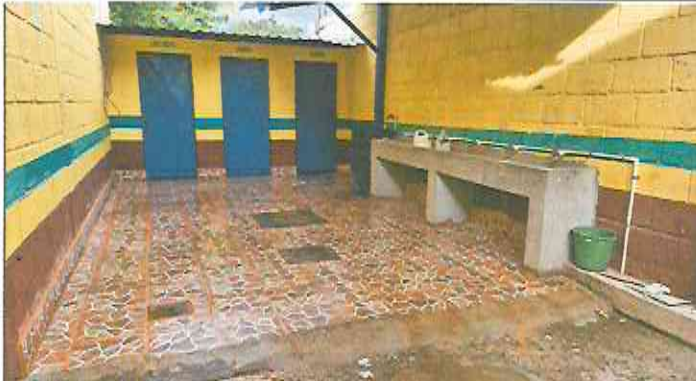
Foto 1: Instalación de piso cerámico (antideslizante) y pintura interior, exterior y puertas.