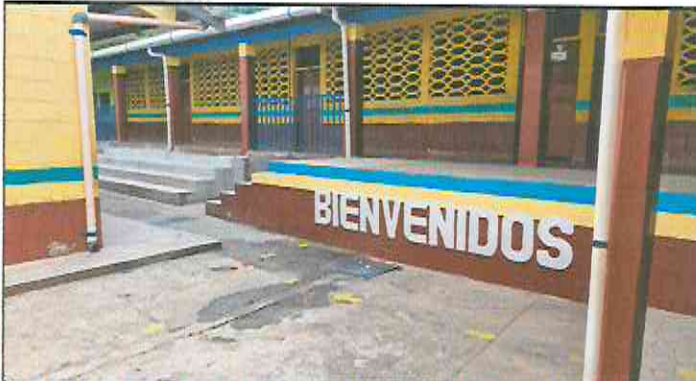
Foto 3: Construcción gradas en escenario, instalación de baranda metálica en corredor, pintura en escenario, construcción de gradas de acceso al corredor y banqueta.