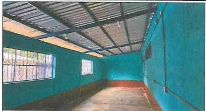
Foto 2: Retiro de lámina existente, mantenimiento de estructura existente (limpieza, lijado y pintura anticorrosiva), reforzamiento de estructura con costanera de 2x4, instalación de lámina troquelada aluzinc cal. 26, reparación eléctrica iluminación y fuerza, levantado de hiladas de block, pintura en balcones existentes y pintura de interior y exterior.