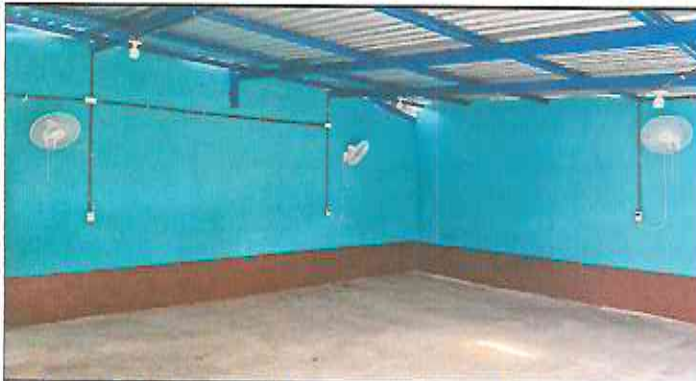
Foto 3: Retiro de lámina existente, mantenimiento de estructura existente (limpieza, lijado y pintura anticorrosiva), reforzamiento de estructura con costanera de 2x6, instalación de lámina troquelada aluzinc cal. 26.