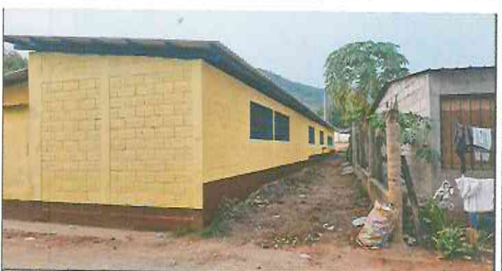
Foto 6: Retiro de lámina existente, mantenimiento de estructura existente (limpieza, lijado y pintura anticorrosiva), reforzamiento de estructura con costanera de 2x4, instalación de lámina troquelada aluzinc cal. 26, reparación eléctrica iluminación y fuerza, levantado de hiladas de block, pintura en balcones existentes y pintura de interior y exterior.

Observación: Si es necesario se pueden agregar fotos adicionales y actualizar el número de hojas.