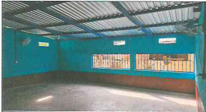
Foto 1: Abertura de ventanas en muro existente de 2.00x1.00mts, instalación de balcones en ventanas de 2.00x1.00mts, pintura interior y exterior, pintura interior y exterior.