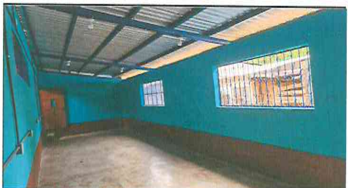
Foto 4: Retiro de lámina existente, mantenimiento de estructura existente (limpieza, lijado y pintura anticorrosiva), reforzamiento de estructura con costanera de 2x4, instalación de lámina troquelada aluzinc cal. 26, reparación eléctrica iluminación y fuerza, levantado de hiladas de block, pintura en balcones existentes y pintura de interior y exterior.