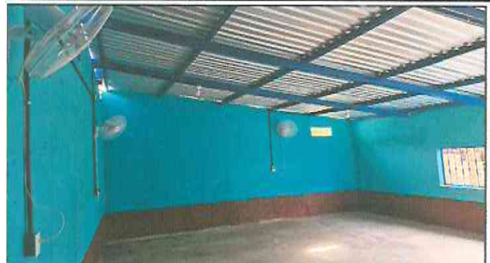
Foto 2: Abertura de ventanas en muro existente de 2.00x1.00mts, instalación de balcones en ventanas de 2.00x1.00mts, pintura interior y exterior, pintura interior y exterior.