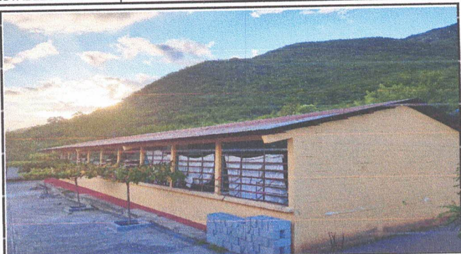
Foto1: Retiro de lámina existente, Mantenimiento de estructura existente (limpieza, lijado y pintura anticorrosiva), instalación de lámina troquelada aluzinc cal. 26 y mantenimiento de puertas.