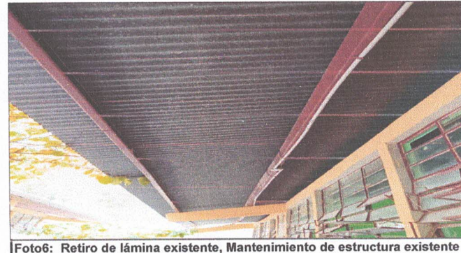
Foto6: Retiro de lámina existente, Mantenimiento de estructura existente (limpieza, lijado y pintura anticorrosiva), instalación de lámina troquelada aluzinc cal. 26 y mantenimiento de puertas.

Observación: Si es necesario se pueden agregar hojas adicionales y actualizar el número de hojas.