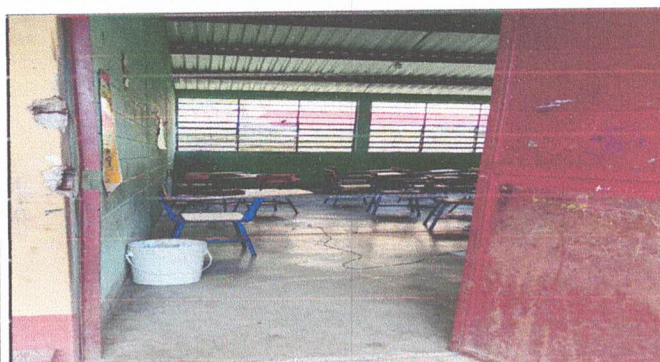
Foto3: Retiro de lámina existente, Mantenimiento de estructura existente (limpieza, lijado y pintura anticorrosiva), instalación de lámina troquelada aluzinc cal. 26 y mantenimiento de puertas.