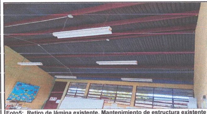
Foto5: Retiro de lámina existente, Mantenimiento de estructura existente (limpieza, lijado y pintura anticorrosiva), instalación de lámina troquelada aluzinc cal. 26 y mantenimiento de puertas.