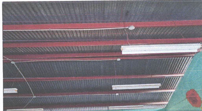
Foto4: Retiro de lámina existente, Mantenimiento de estructura existente (limpieza, lijado y pintura anticorrosiva), instalación de lámina troquelada aluzinc cal. 26 y mantenimiento de puertas.