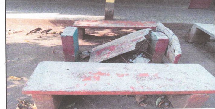
plancha de concreto para mesa

Observación: Si es necesario se pueden agregar hojas adicionales y actualizar el número de hojas.