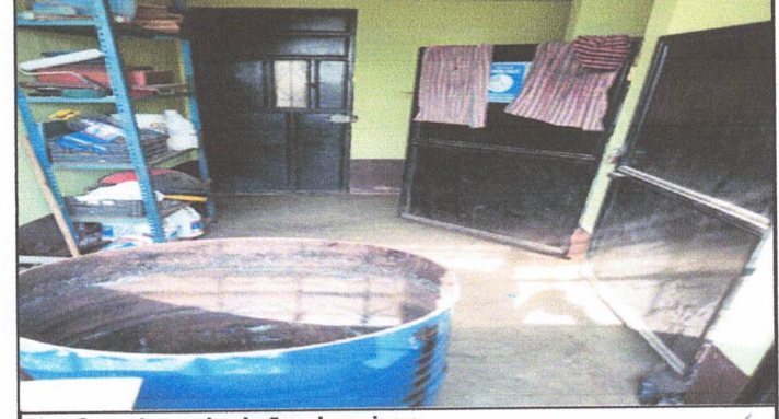
Piso Ceramico en los baños de mujeres