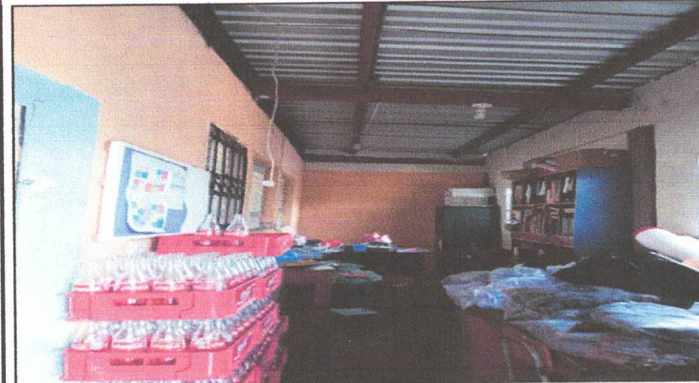
Cielo Falso en el area de la dirección