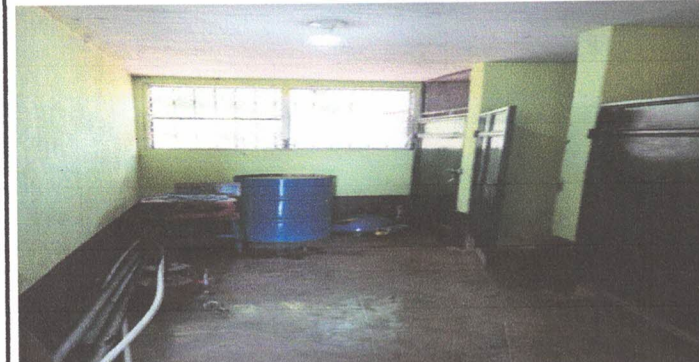
Piso ceramico en los baños de hombres