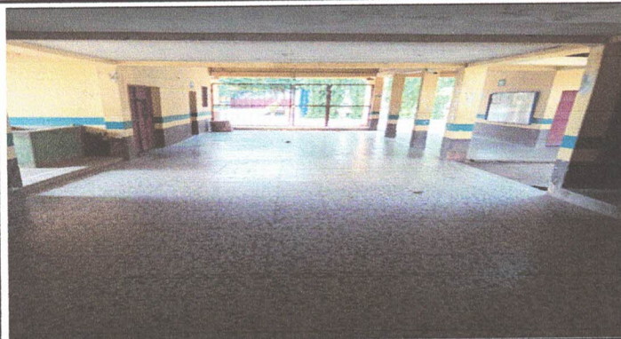
Pintura Interior y exterior del Establecimiento Educativa