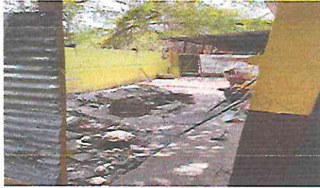
Foto1: Demolición de muro y concreto de la Escuela