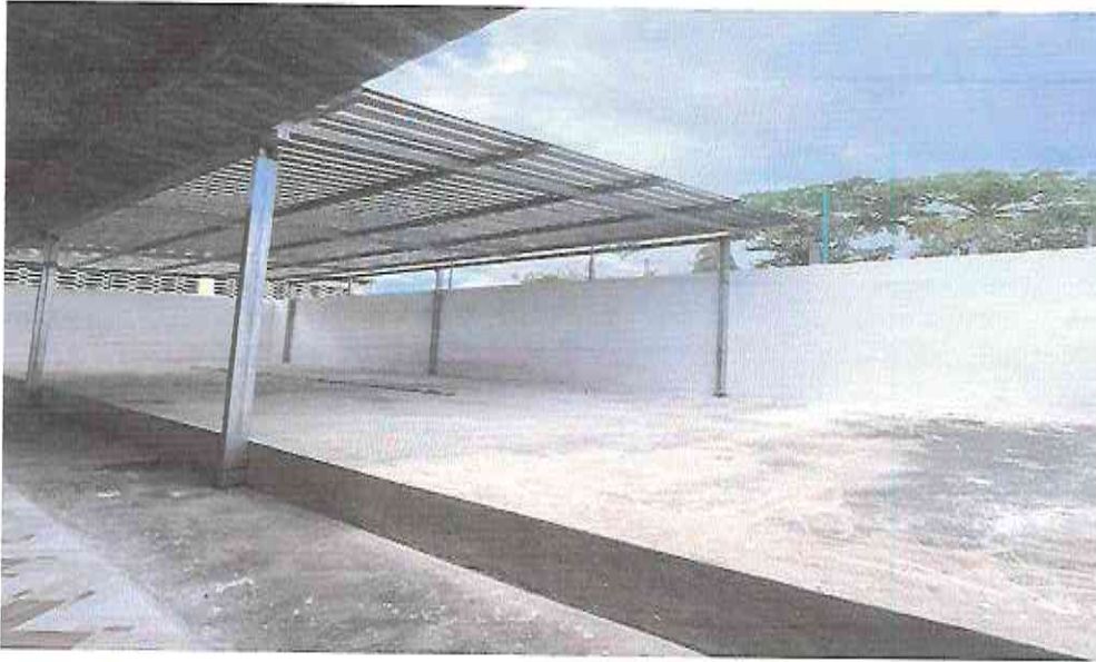
Repello en muros interiores de toda la Escuelita