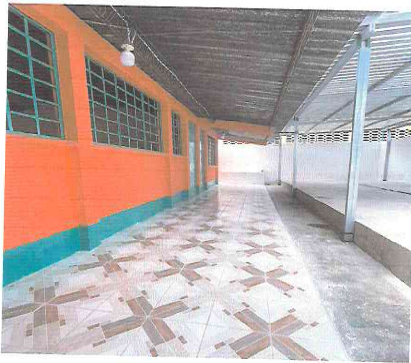
Cerámico en el corredor y cambio de Focos ahorradores