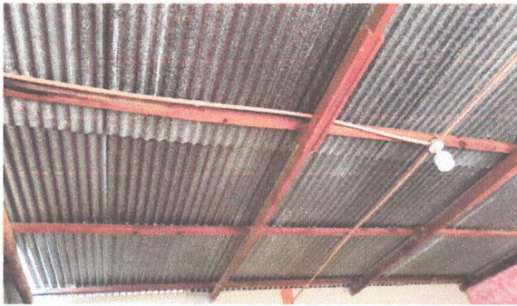
1.3 Sustitución de estructura de soporte de madera, por metal