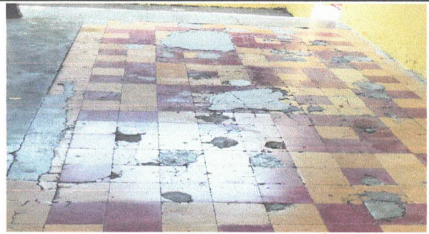
1.2 Sustitución de piso por piso cerámico