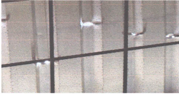
1.1 Sustitución de láminas por lámina troquelada de aluzinc