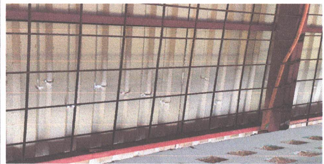
1.4 Mantenimiento a estructura de soporte de metal