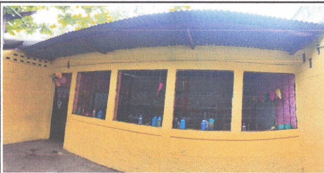
Aula No. 1 en la cual se cambiará estructura metálica y láminas. (Techo completo)