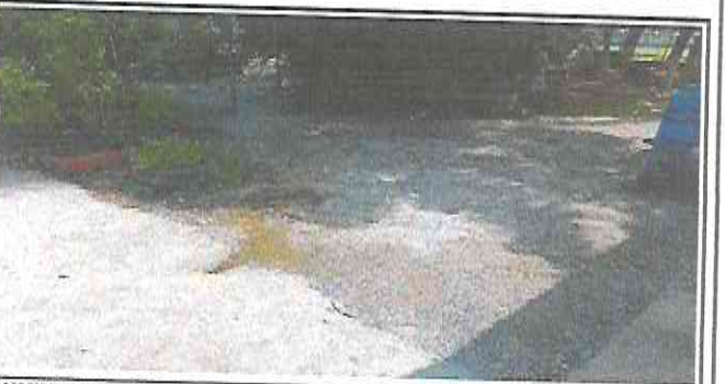
SUMINISTRO E INSTALACION DE PISO DE TORTA DE CEMENTO EN AREA DE ENTRADA DEL ESTABLECIMIENTO

Observación: Si es necesario se pueden agregar hojas adicionales y actualizar el número de hojas.