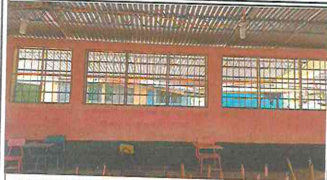
INSTALACION DE 55 M 2 DE MOSQUITEROS EN AULAS DE PRIMERO, SEGUNDO Y TERCER GRADO