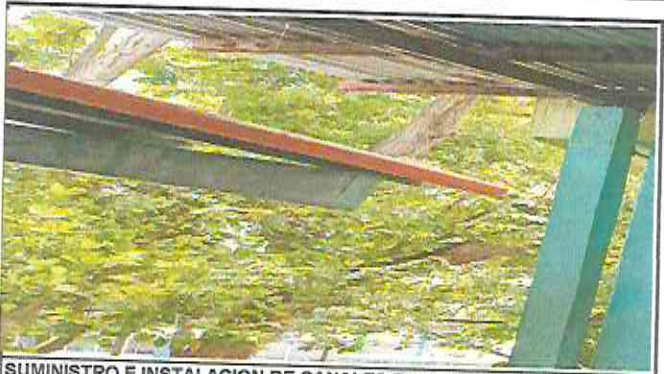
SUMINISTRO E INSTALACION DE CANALES EN AREA DE AULA DE 4 GRADO Y AULA DE AULA DE TELESECUNDARIA ANEXA AL ESTABLECIMIENTO