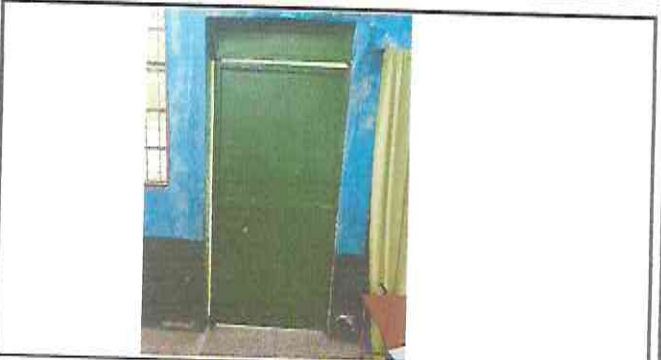
MANTENIMIENTO A 7 PUERTAS DE METAL DEL MISMO ESTILO Y MEDIDADAS EN AULAS