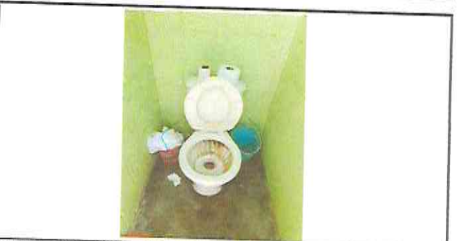
SUMINISTRO E INSTALACION DE 3 SANITARIOS EN AREA DE BAÑOS