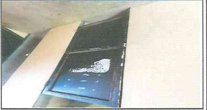
Puerta de baños en mal estado