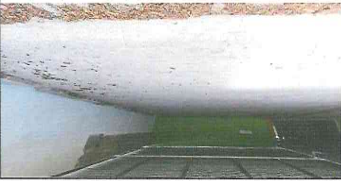
Falta de repello en pared de área para actividades frente a salones de clases.

Observación: Si es necesario se pueden agregar hojas adicionales y actualizar el número de hojas.