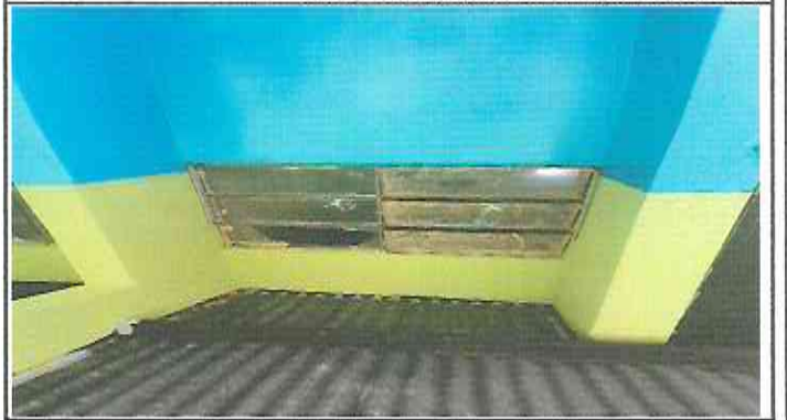
Ventanas en módulos de baños en mal estado