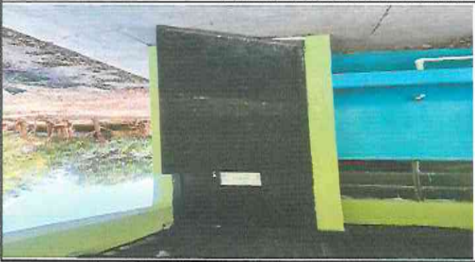
Puerta de ingreso a baños en mas estado