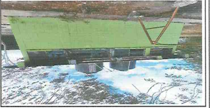
Accesorios de tinacos descompuestos