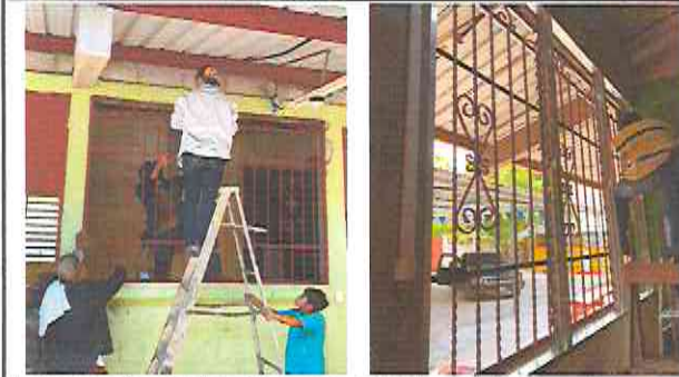
Foto 7: sustitución de ventana en mal estado por balcón y ventana de paletas