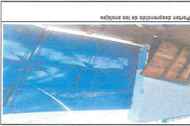
Puerta desprendido de los anclajes