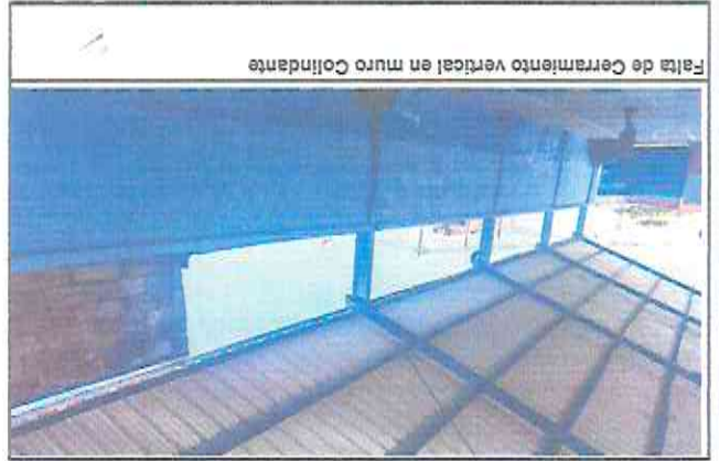
Falta de Cerramiento vertical en muro Colindante