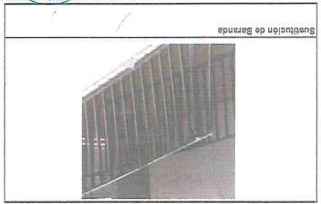
Sustitución de Baranda