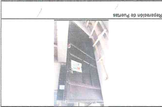
Reparación de Puertas