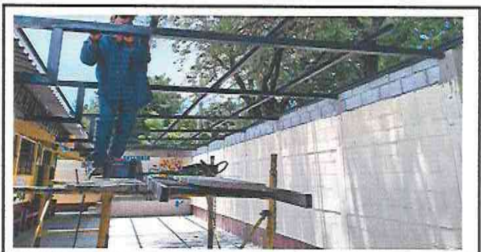
Foto 6: Suministro e Intalación de estructura de soporte metal para instalación de lamina en area de escenario y patio.

Observación: Si es necesario se pueden agregar hojas adicionales y actualizar el número de hojas.