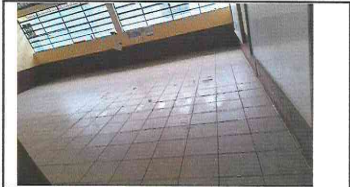
Foto 2: Suministro e Instalación de Piso Ceramico sobre piso de Concreto en todas las aulas (Aula 2)