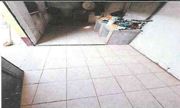
Foto 9: Suministro e Instalación de piso ceramico sobre piso de concreto en cocina