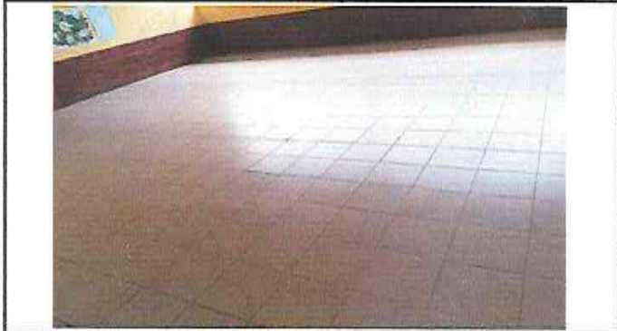
Foto 1: Suministro e Instalación de Piso Ceramico sobre piso de concreto en todas las aulas (Aula 1)