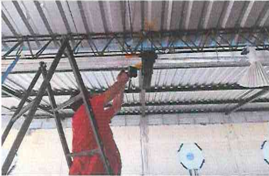
Foto 7: Suministro e Instalación de canal en area afuera de todas las aulas y la galera que se hara continua al escenario