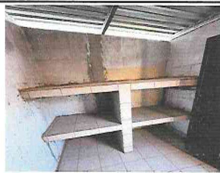
Foto 10: Instalación de gabinete de concreto con acabado de cernido fino de cemento de 4 m2