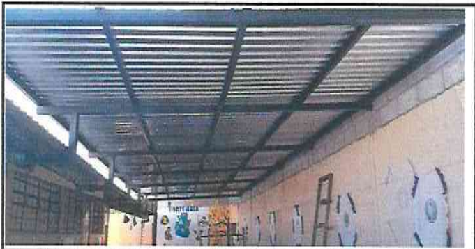
Foto 5: Suministro e Instalación de lamina troquelada aluzinc calibre 26 en area de escenario y patio