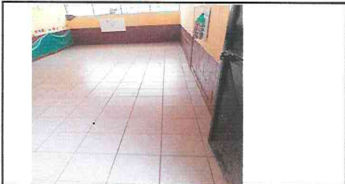
Foto 3: Suministro e Instalación de Piso Ceramico sobre piso de concreto en todas las aulas (Aula 3)