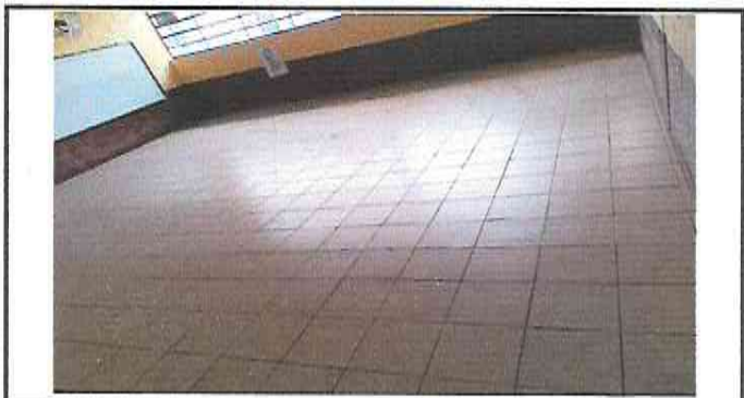
Foto 4: Suministro e Instalación de Piso Ceramico sobre piso de Concreto en Dirección