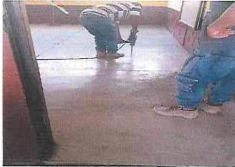
Foto 1: Suministro e Instalación de Piso Ceramico sobre piso de concreto en todas las aulas (Aula 1)