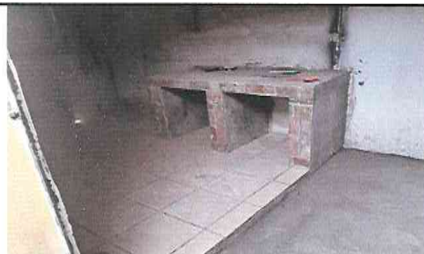
Foto 9: Suministro e instalación de piso ceramico sobre piso de concreto en cocina