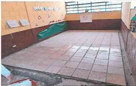
Foto 3: Suministro e Instalación de Piso Ceramico sobre piso de concreto en todas las aulas (Aula 3)