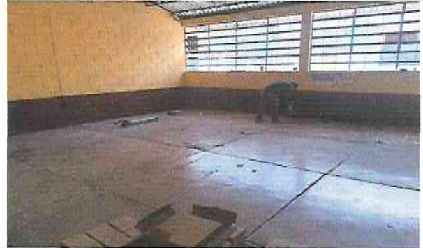
Foto 2: Suministro e Instalación de Piso Ceramico sobre piso de Concreto en todas las aulas (Aula 2)