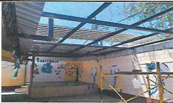
Foto 5: Suministro e Instalación de lamina troquelada aluzinc calibre 26 en area de escenario y patio