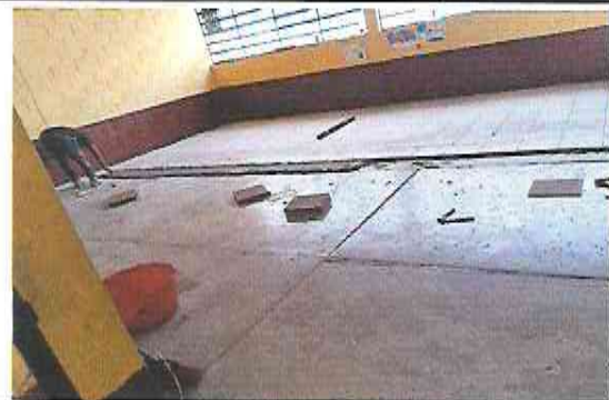
Foto 4: Suministro e Instalación de Piso Ceramico sobre piso de Concreto en Dirección