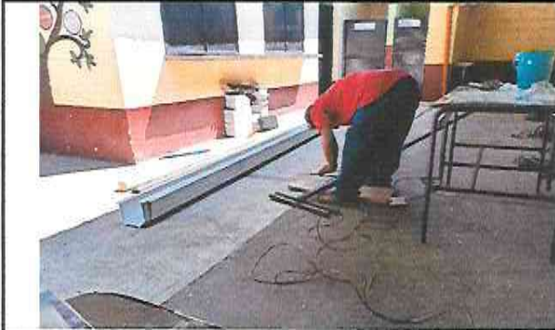
Foto 7: Suministro e instalación de canal en area afuera de todas las aulas y la galera que se hara continua al escenario