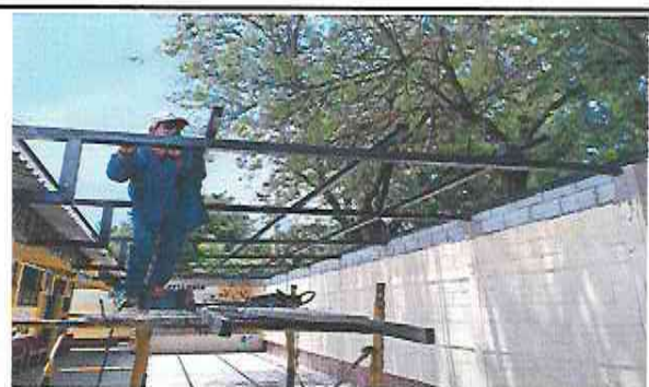
Foto 6: Suministro e Intalación de estructura de soporte metal para instalación de lamina en area de escenario y patio.

Observación: Si es necesario se pueden agregar hojas adicionales y actualizar el número de hojas.