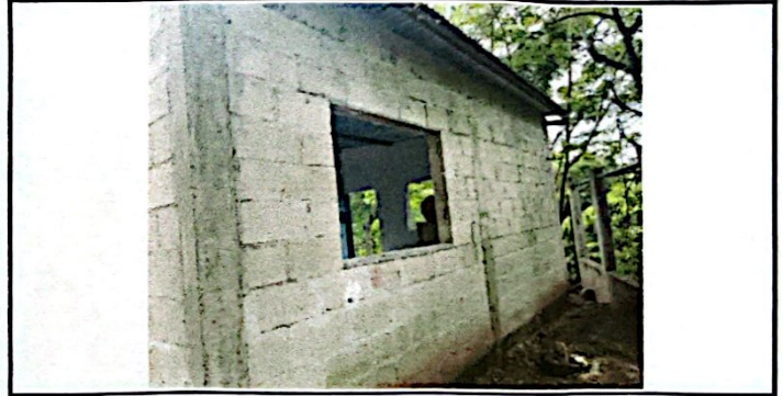
Foto 10: Sustitución de Cemento Gris en Paredes Exteriores de Cocina.