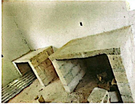
Foto 1: Reparación de Cocina y Reparación Sistema Eléctrico, flaponera, foco, flexitubo, abrazaderas, cables, tomacorrientes e interruptores.