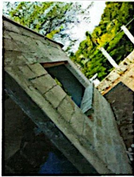
Foto 3: Reparación de Cocina y Reparación Sistema Eléctrico, flaponera, foco, flexitubo, abrazaderas, cables, tomacorrientes e interruptores y tallados y cernidos en paredes exteriores.