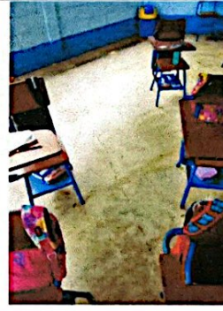
Foto 4: Reparación de Piso en Aula Exagonal. Sustitución de piso de concreto a piso cerámico y Pintura general en Aulas.