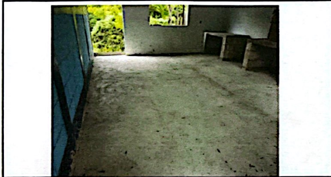
Foto 9: Sustitución de Piso Cerámico en Cocina, sustitución de Balcones, Sustitución de Tallados a Gabinetes, vanos en Puertas y Ventanas.