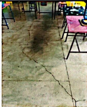
Foto 5: Reparación de Piso en Aula. Sustitución de piso de concreto a piso cerámico y Pintura general en Aulas.