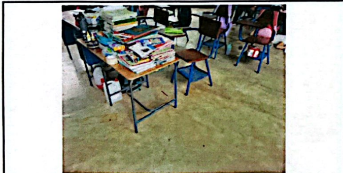
Foto 11: Reparación de Piso en Aula. Sustitución de piso de concreto a piso cerámico y Pintura general en Aulas.