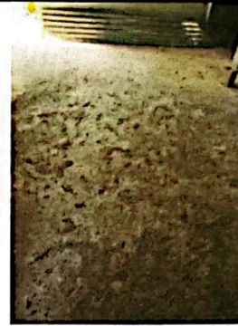
Foto 2: Reparación de Cocina y Reparación Sistema Eléctrico, flaponera, foco, flexitubo, abrazaderas, cables, tomacorrientes e interruptores.