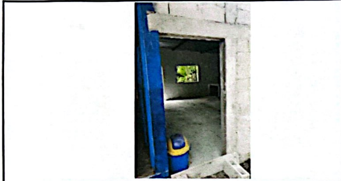
Foto 7: Reparación de Cocina y Reparación Sistema Eléctrico, flaponera, foco, flexitubo, abrazaderas, cables, tomacorrientes e interruptores y tallados, cementos en paredes exteriores y Aplicación de Pintura Latex para Exterior e Interior.