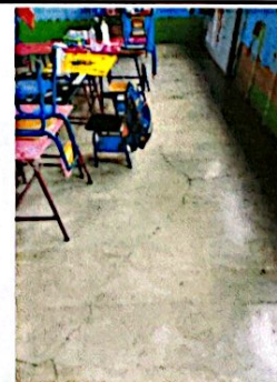
Foto 6: Reparación de Piso en Aula. Sustitución de piso de concreto a piso cerámico y Pintura general en Aulas.

Observación: Si es necesario se pueden agregar hojas adicionales y actualizar el número de Hojas.