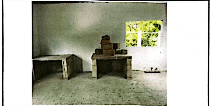
Foto 8: Reparación de Cocina y Reparación Sistema Eléctrico, flaponera, foco, flexitubo, abrazaderas, cables, tomacorrientes e interruptores y tallados, cementos en paredes exteriores y Aplicación de Pintura Latex para Exterior e Interior.