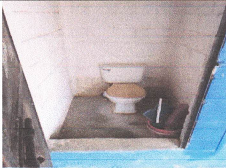
sustitucion de mingitorio y inodoro