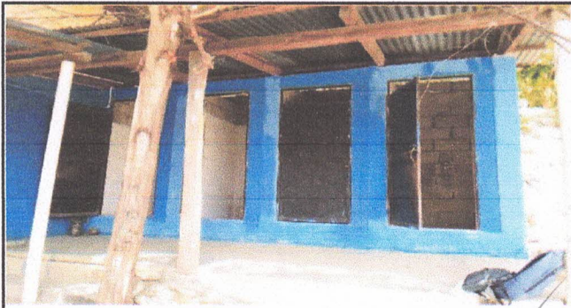
Sustitucion de puerta