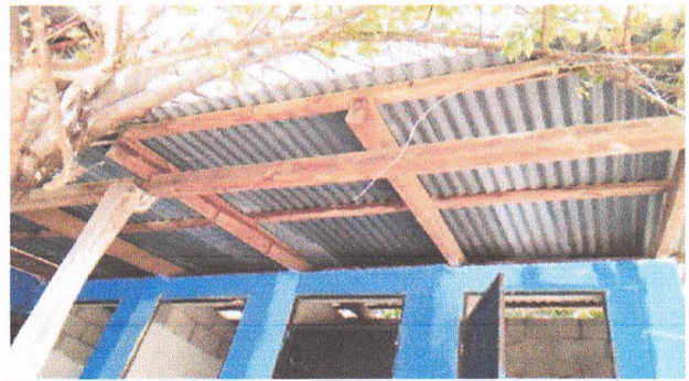
Sustitucion de estructura de madera, por metal