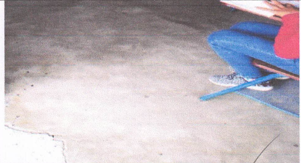
Sustitucion de piso de granito

Observación: Si es necesario se pueden agregar hojas adicionales y actualizar el número de hojas.