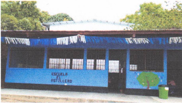
Sustitucion de estructura de metal de ventana