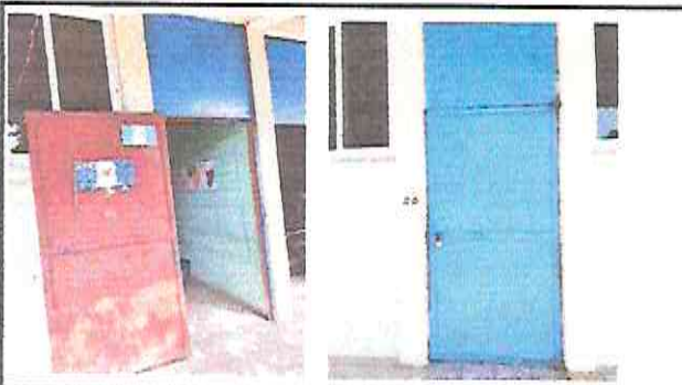
Foto 5: Mantenimiento a estructura (lijado, cambio de tubo, cepillado, sujetones, aplicación de pintura)