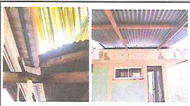
Foto 2: Sustitución o instalación de estructura de soporte de metal