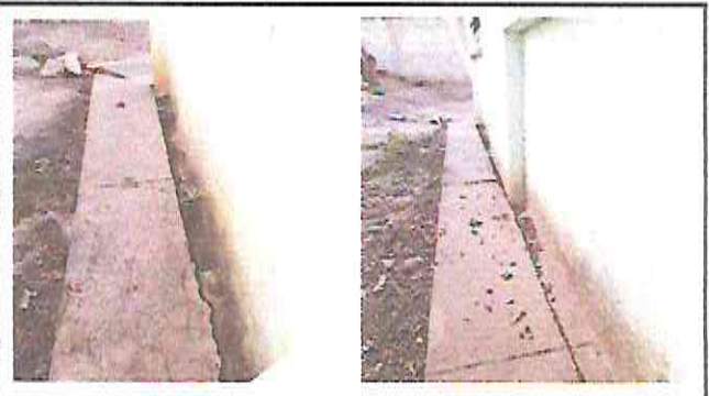
Foto 4: Sustición o instalación de bajada de agua pluvial de tubo PVC 3"