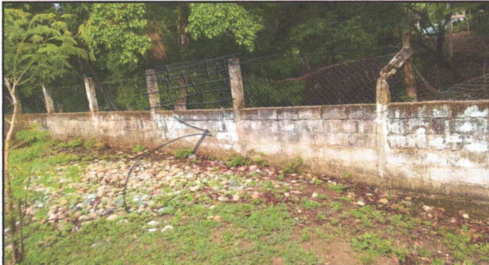
Foto 1: MURO PERIMETRAL DAÑADO, SUSTITUCION DE MALLA Y REPARACION DE BLOCK CON CEMENTO. Si tiene columnas