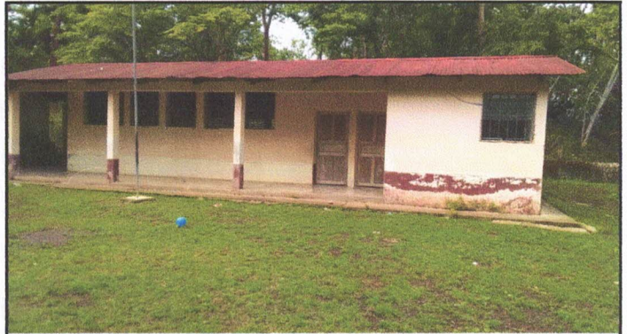
Foto 4: REPARACION DE LAMINA Y ESTRUCTURA Mantenimiento de estructura / Cambio de lámina.