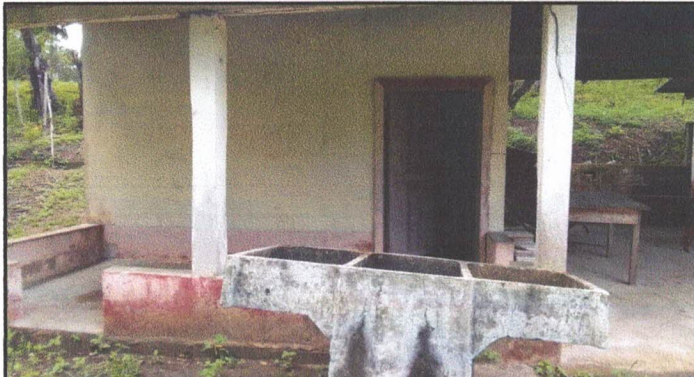
Foto 3: SUSTITUCION DE CHAPAS Y RESTAURACION DE PUERTAS EN LOS MODULOS