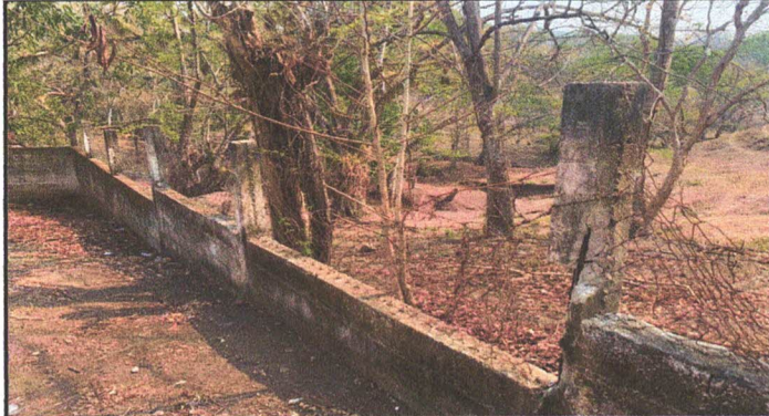
Foto 1: MURO PERIMETRAL DAÑADO, SUSTITUCION DE MALLA Y REPARACION DE BLOCK CON CEMENTO. ✓