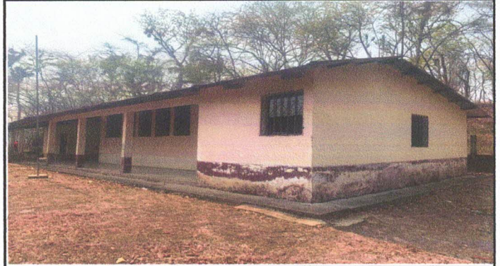
Foto 2: PINTURA EN PARTE INTERNA Y EXTERNA DE LOS MÓDULOS DEL EDIFICIO. ✓