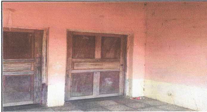
Foto 3: SUSTITUCION DE CHAPAS Y RESTAURACION DE PUERTAS EN LOS MÓDULOS ✓