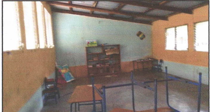
Foto 2: PINTURA EN PARTE INTERNA Y EXTERNA DE LOS MODULOS DEL EDIFICIO.