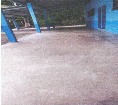
Foto1: sustitución de piso de cemento liquido.