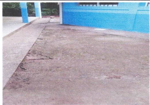
Foto4: sustitución de torta de concreto de cemento.