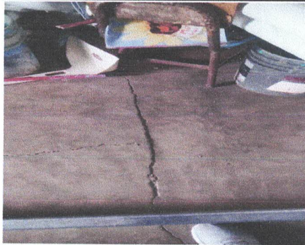
Foto5: sustitución de piso de cemento líquido.