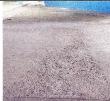
Foto6: sustitución de torta de concreto de cemento.

Observación: Si es necesario se pueden agregar hojas adicionales y actualizar el número de hojas.