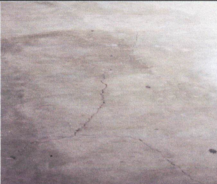
Foto3: sustitución de piso de cemento liquido.