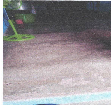
Foto4: sustitución de piso de cemento líquido.