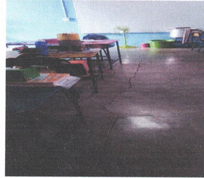
Foto2: sustitución de piso de cemento líquido.