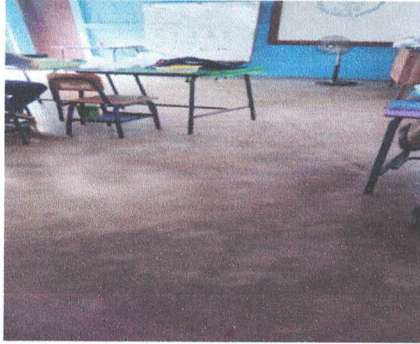
Foto1: sustitución de piso de cemento líquido.