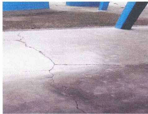
Foto2: sustitución de piso de cemento liquido.