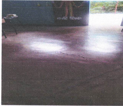
Foto3: sustitución de piso de cemento líquido.