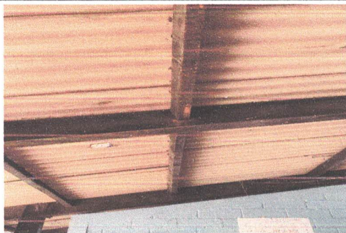
Foto1: Sustitución de lámina por lámina troquelada calibre 26