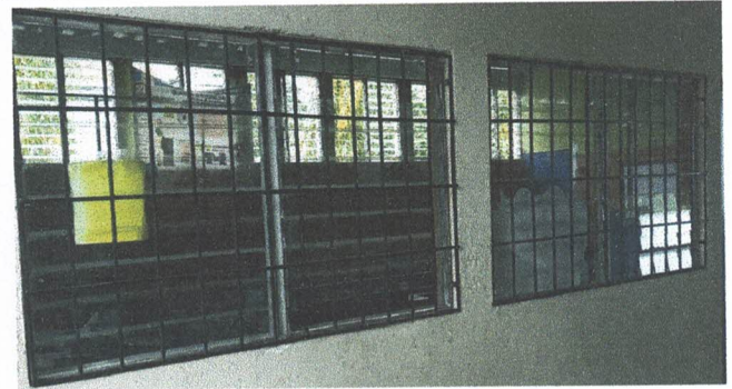
Foto 8: Sustitución de estructura de metal y vidrio (paletas) en 4 ventanas por ventanas de material de PVC corredizas de 2.35 mts de ancho x 1,425 mts de alto, Modulo de aulas