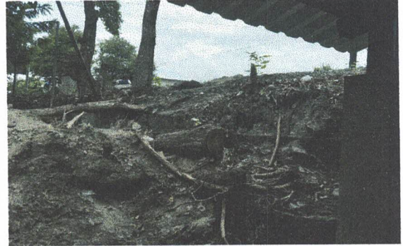
Foto 2: Sustitución de muro perimetral de block dañado por las lluvias (Incluye block, cemento, piedrín, arena, hierro y mano de obra calificada)