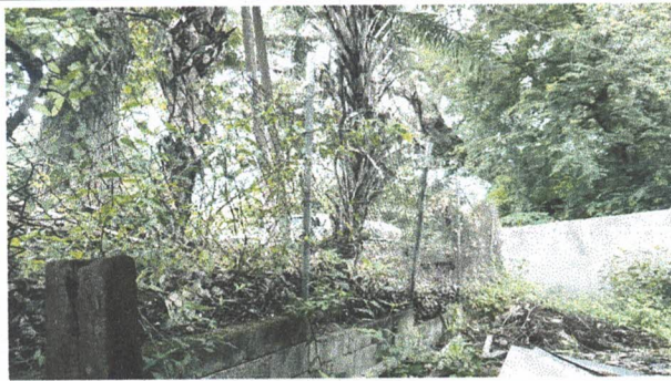
Foto 5: Sustitución de muro perimetral de block dañado por las lluvias (Incluye block, cemento, piedrín, arena, hierro y mano de obra calificada)