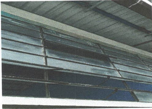
Foto 7: Sustitución de estructura de metal y vidrio (paletas) en 4 ventanas por ventanas de material de PVC corredizas de 2.35 mts de ancho x 1,425 mts de alto. Modulo de cocina