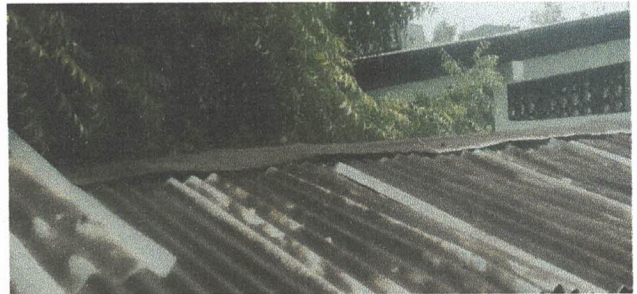
Foto 12: Sustitución de lámina por lámina troquelada aluzinc calibrte 26 en el area de cocina

Observación: Si es necesario se pueden agregar hojas adicionales y actualizar el número de hojas.