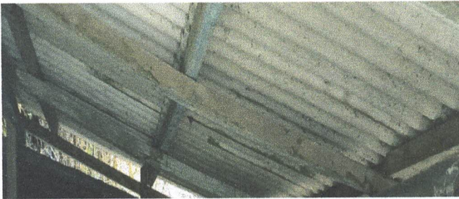
Foto 11: Sustitución de estructura de soporte de madera por metal (costanera) en el área de cocina