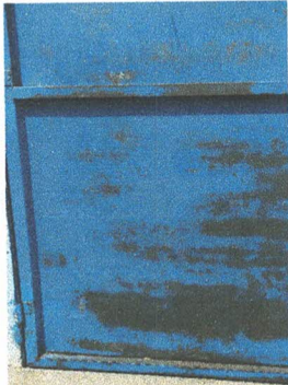
Foto 9: Sustitución de puerta de metal de 2.05 mts de alto y 1.02 mts de ancho en el area de cocina