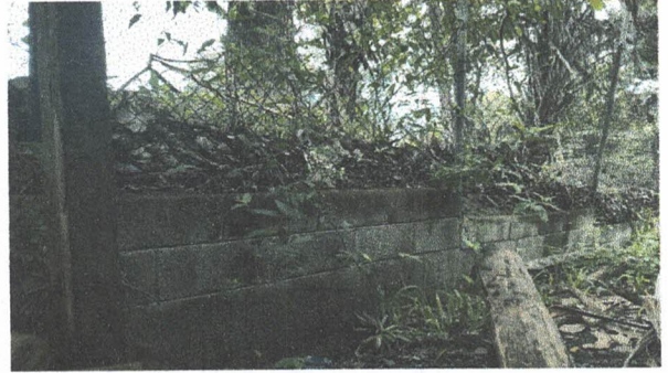
Foto 4: Sustitución de muro perimetral de block dañado por las lluvias (Incluye block, cemento, piedrín, arena, hierro y mano de obra calificada)