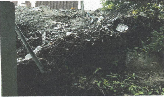
Foto 1: Sustitución de muro perimetral de block dañado por las lluvias (Incluye block, cemento, piedrín, arena, hierro y mano de obra calificada)