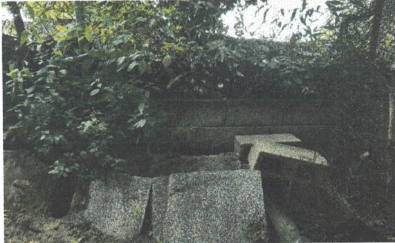
Foto 3: Sustitución de muro perimetral de block dañado por las lluvias (Incluye block, cemento, piedrín, arena, hierro y mano de obra calificada)