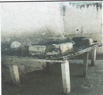
Foto 13: Sustitución de estufa rural completa (polletón, chimenea, hornilla metálica, gorrito de chimenea y mano de obra)

Observación: Si es necesario se pueden agregar hojas adicionales y en el primer número de hojas.