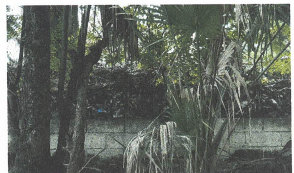
Foto 6: Sustitución de muro perimetral de block dañado por las lluvias (Incluye block, cemento, piedrín, arena, hierro y mano de obra calificada)

Observación: Si es necesario se pueden agregar hojas adicionales y actualizar el número de hojas.