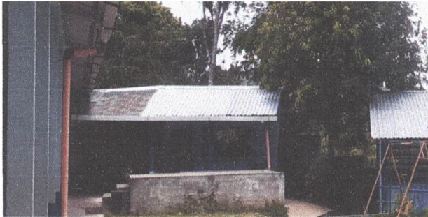
Foto1: Sustitución de lámina troquelada por lámina troquelada aluzinc calibre 26