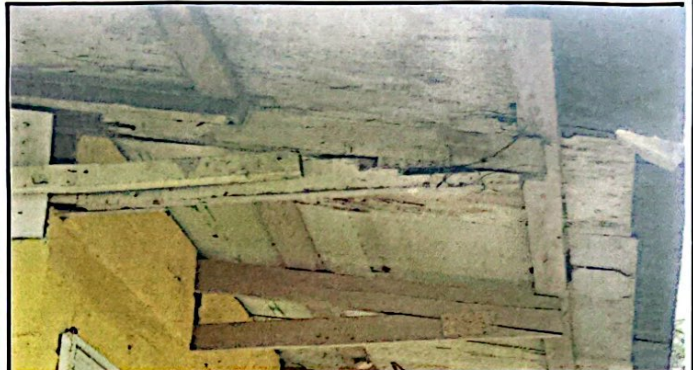
Foto 2: 1.2 SUSTITUCIÓN DE ESTRUCTURA DE MADERA POR ESTRUCTURA METALICA