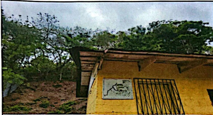
Foto 1: 1.1 SUSTITUCIÓN DE LAMINA POR LAMINA TROQUELADA CALIBRE 26