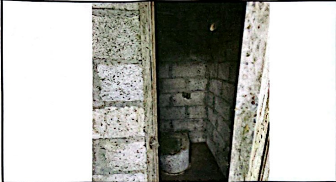
Foto 7: 2.3 SUSTITUCIÓN DE LETRINA CIEGA POR BAÑO LAVABLE Y SUS ACCESORIOS