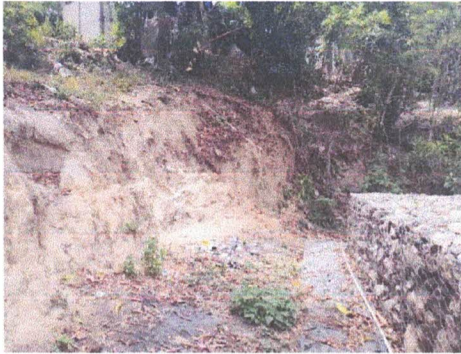
Foto 1: Área en donde se realizara remozamiento de talud con colaboración de la comunidad, se reemplazara galera de madera que fue destruida por desplome del talud.