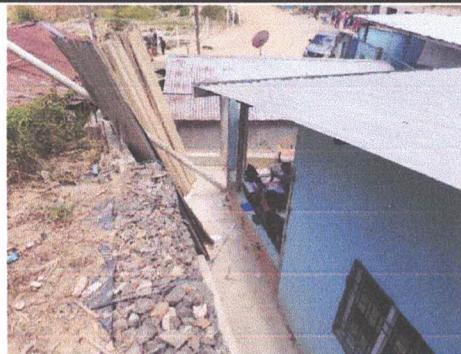
Foto 3: Punto en donde se instalará graderío metálico para acceder al área elevada del establecimiento.