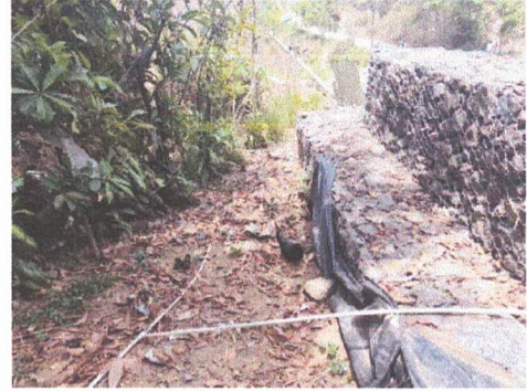
Foto 2: Área donde se instalara caminamiento peatonal para protección de tuberías y peatones.