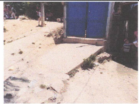
Foto 5: Rampa en mal estado y que no conduce al nivel adecuado, actualmente es una barrera arquitectónica que se pretende eliminar.